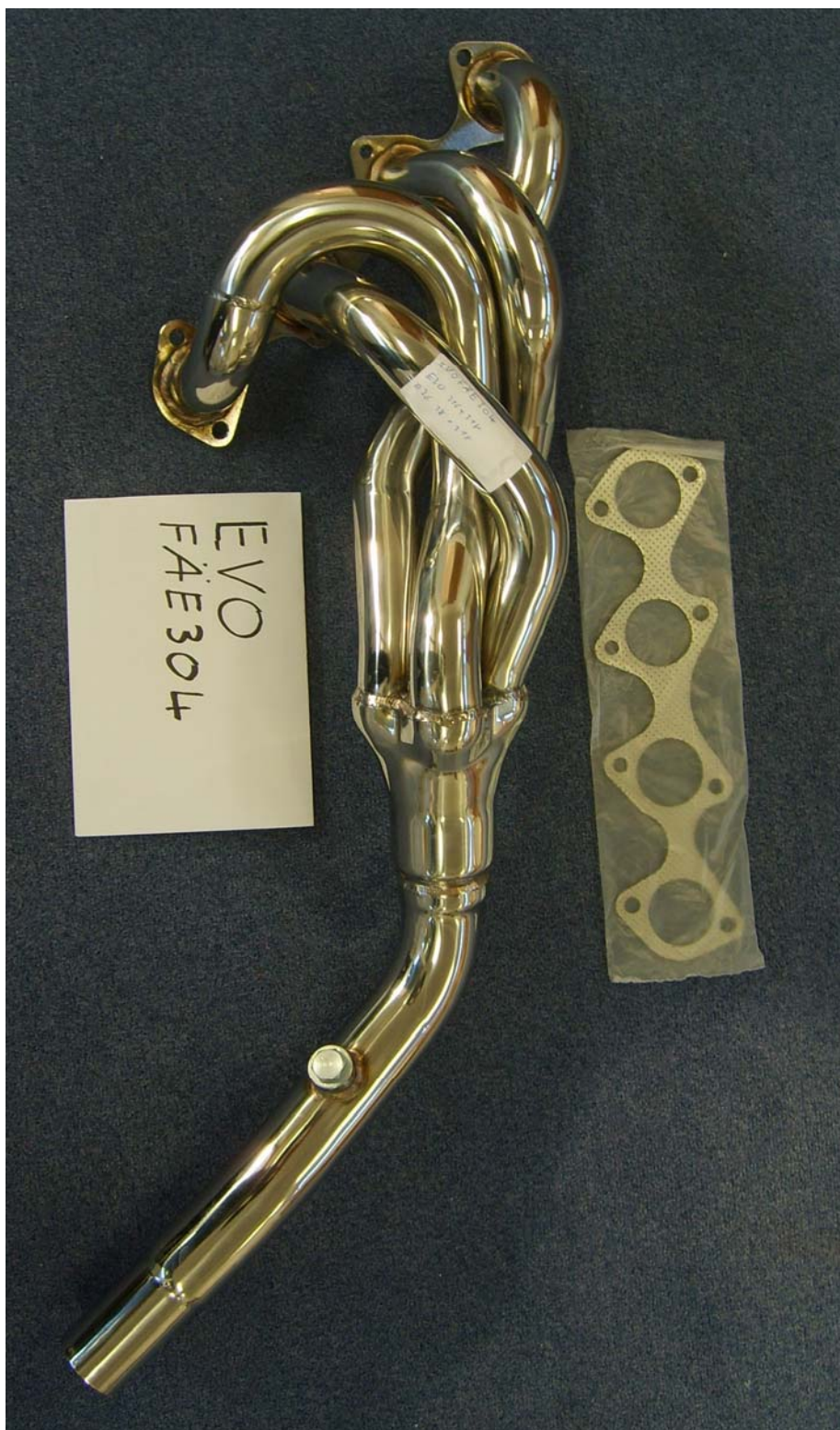
Auspuffkrümmer, Typ EVOFAE304