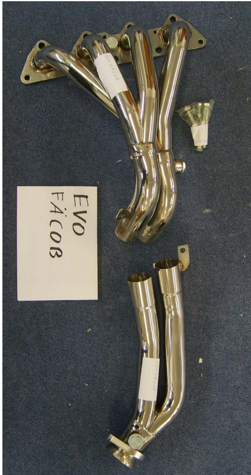
Auspußkrümmer, Typ EVOFÄCCOB